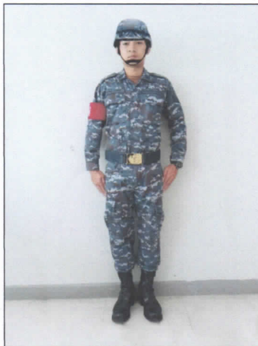
รูปที่ ๒ เครื่องแบบพิเศษสำหรับทหารชายที่ปฏิบัติหน้าที่สารวัตรทหารอากาศขณะปฏิบัติราชการสนาม (หมวกสนามสีเทาหุ้มผ้าสีพราง)