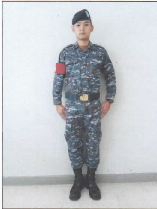
รูปที่ ๑ เครื่องแบบพิเศษสำหรับทหารชายที่ปฏิบัติหน้าที่สารวัตรทหารอากาศขณะปฏิบัติราชการสนาม (หมวกทรงอ่อนสีน้ำเงินดำ)

เครื่องแบบพิเศษสำหรับทหารชายที่ปฏิบัติหน้าที่สารวัตรทหารอากาศขณะปฏิบัติราชการสนาม