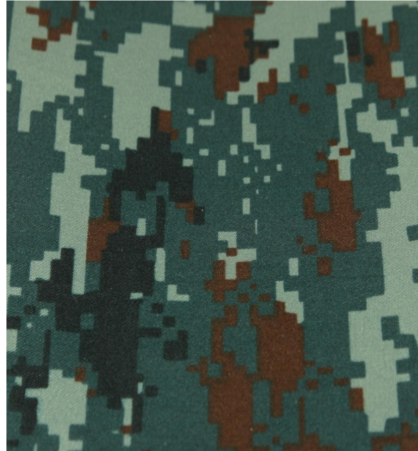
ลวดลายและสีผ้า : สีดำ, สีน้ำตาล, สีเทาอ่อน และสีเทาเข้ม