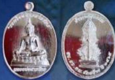
เหรียญเนื้อเงิน