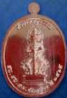
เหรียญเนื้อทองแดงผิวไฟ